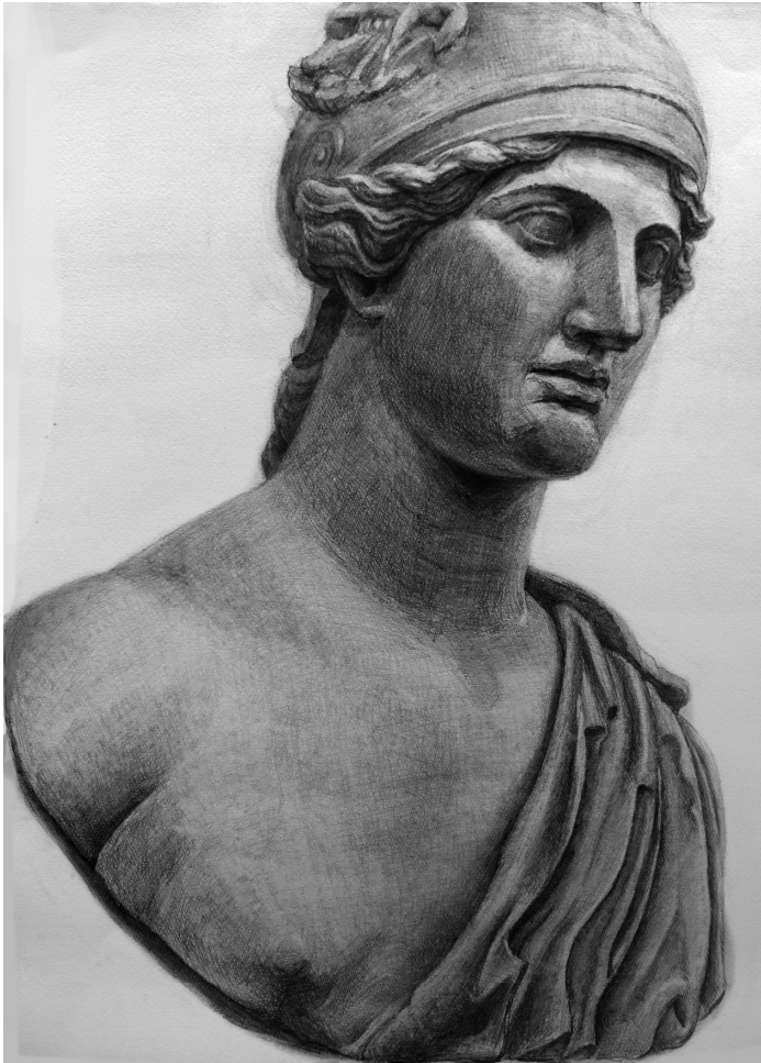
夜間コース 生徒作品