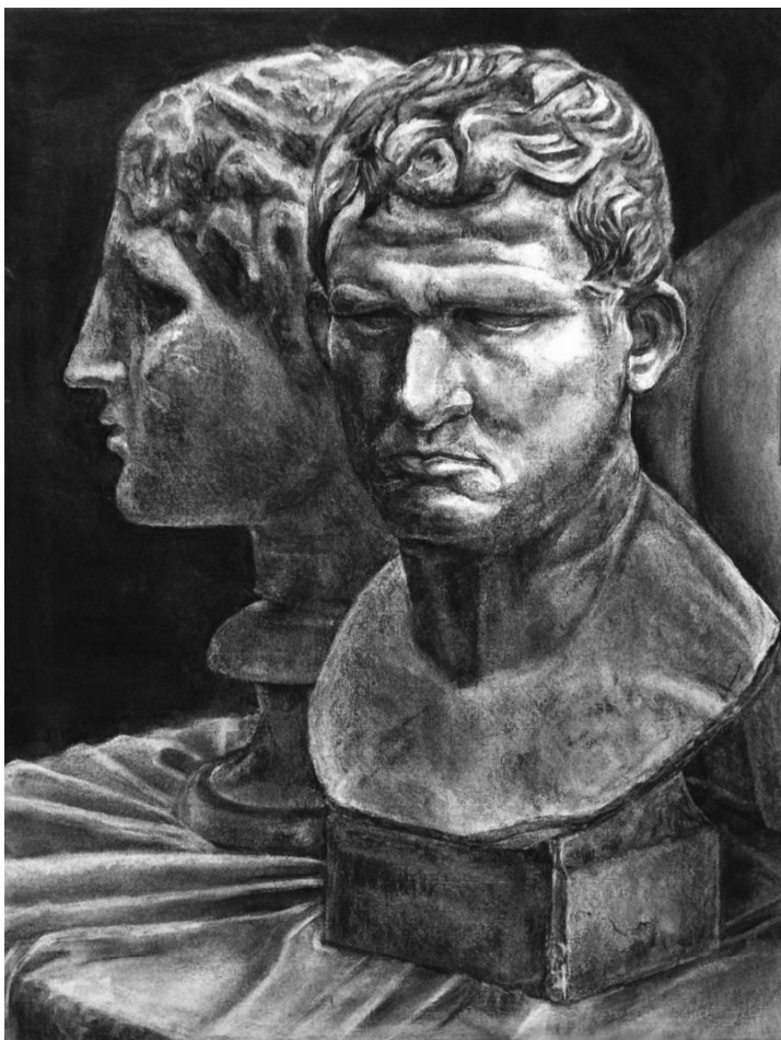
絵画コース 生徒作品